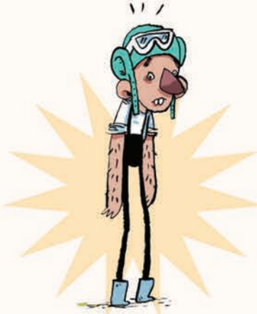
نپ دستیار (نه چندان بدجنس) دکتر پروت