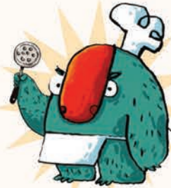
سرآشیز مالوله هیولای آشنیزی