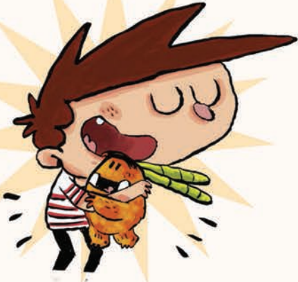
آگوس بیانولا و آقای پتی پین، هیولای کتاب ها