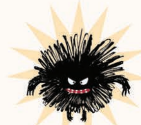
چوله هیولای چاله ها