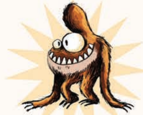
گیسی پیلی هیولای موها