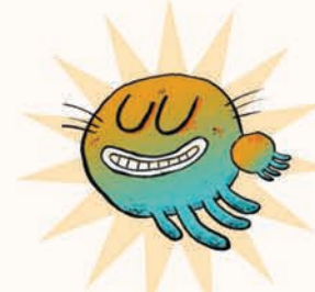
هیچو پیچو هیولای هیچی