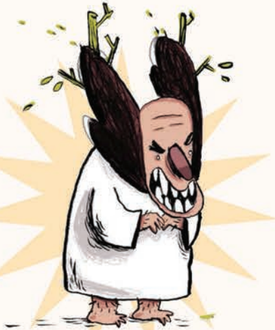
دکتر پروت مرد خپیش