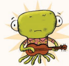
اختاسل هیولای موسیقی