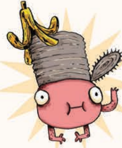
جیرینگ هیولای زباله