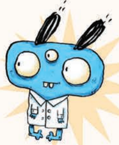
خانم دکتر دامپی هیولای حیوانات