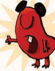
خانم قلمبو هیولای قلم مو