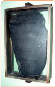
سنگ پالمو، تکه‌ای بزرگ از یک ستون سنگی یادبود به نام «سالنامه شاهی» مربوط به پادشاهی کهن مصر است که در موزه شهر پالمو ایتالیا نگهداری می‌شود.