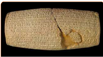
منشور کوروش (منابع دست اول) - در موزه بریتانیا در لندن