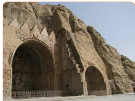
طاق بستان (منابع دست اول) - کرمانشاه