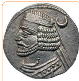
سکه اشکانی (منابع دست اول)