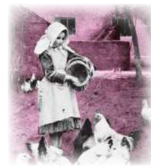
هذه... بِنْتُ... نَاجِحَةٌ.