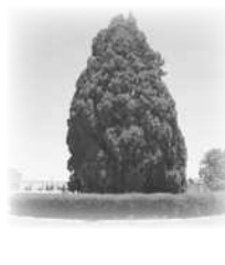
تلك... شَجَرَةٌ... مُرْتَفَعَةٌ.