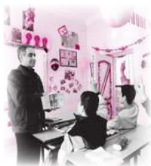
هذا... صَفٌّ... جَمِيلٌ.

جَبَلٌ - شَجَرَةٌ - وُلْدٌ - بِنْتُ - صَفٌّ - فَرِيضَةٌ