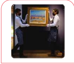
تِلْكَ اللُّوْحَةُ، جَمِيلَةٌ. آن تابلو، زیباست.