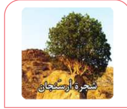
هَذِهِ الشَّجَرَةُ، عَجِيبَةٌ. این درخت، شگفت‌انگیز است.