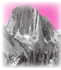
ذلك... جَبَلٌ... كَبِيرٌ.