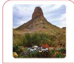
ذَلِكَ الْجَبَلُ، مُرْتَفِعٌ. آن کوه، بلند است.