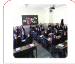
هَذَا الصَّفُّ، كَبِيرٌ. این کلاس، بزرگ است.