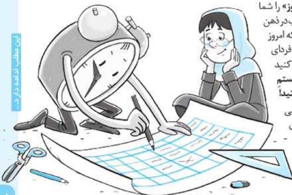
این مطلب ادامه دارد...

۵ تعادل را در برنامه‌ریزی رعایت کنید، یعنی متناسب با زمان، برای دروس مختلف برنامه‌ریزی کنید. می‌توان گفت بهترین شیوه برای رعایت تعادل در برنامه‌ی دروس «برنامه‌ریزی موزاییکی» (جدول خانه‌های خالی) است. برنامه‌ریزی موزاییکی را در مقاله‌ی هفته بعد با هم می‌بینیم.