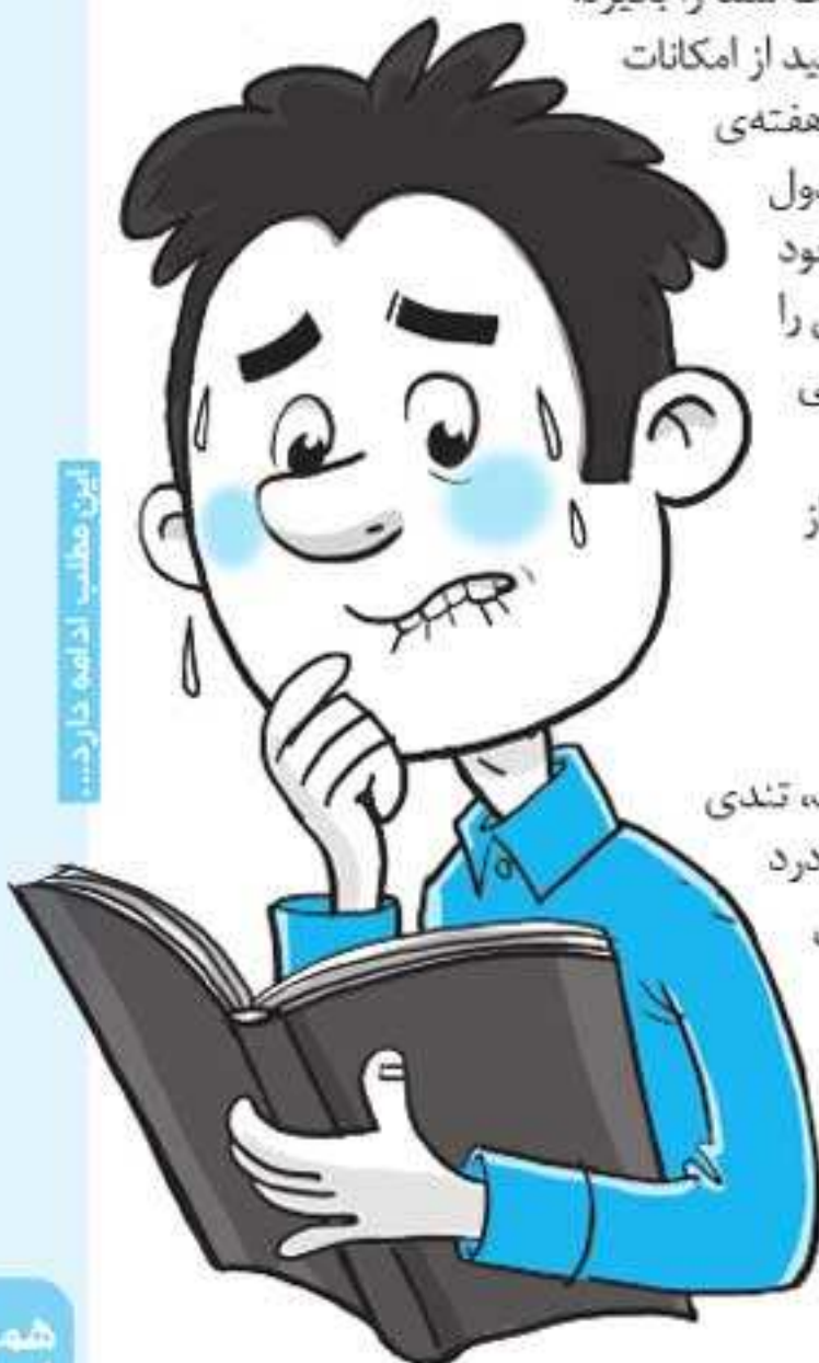
این مطلب ادامه دارد...

تغییرات بدنی که زمان اضطراب رخ می‌دهد: لرزش دست، تعرق، تپش قلب، تند نفس، دلهره، خشکی دهان، داغی بدن، بی‌قراری، تکرر ادرار، سرگیجه، سردرد و سستی. اگر این روند به صورت مداوم ادامه پیدا کند، تغذیه‌ی فرد مختل می‌شود و ممکن است پر خوری یا بی‌اشتهایی به سراغ او بیاید. حالت تهوع، دل‌پیچه یا معده درد هم از دیگر علائم آن است. البته ممکن است فرد مشکل بی‌خوابی و بد خوابی نیز پیدا کند که تمامی این عوامل، روند عادی زندگی و به دنبال آن روند درس خواندن او را تحت تأثیر قرار می‌دهد. بهتر است در صورت مشاهده این موارد به متخصص روانپزشک یا روان‌شناس حوزه‌ی نوجوان مراجعه کنید.