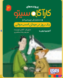
یک روز در میدان اسب‌دوانی