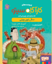
سال نوی چینی