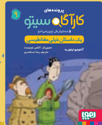
یک داستان خیلی مغناطیسی