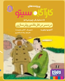
زردسرها در کارخانه‌ی چترسازی