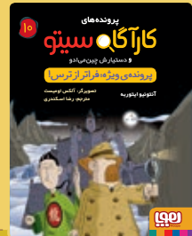
پرونده‌ی ویژه: فراتر از ترس