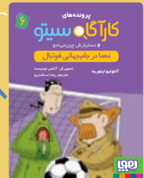
معما در جام جهانی فوتبال