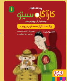
یک دستیار همه فن حریف