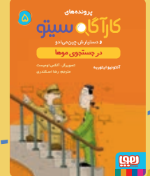
در جستجوی موها