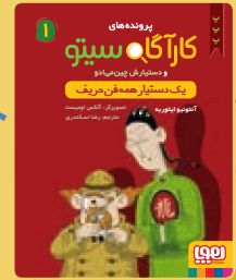
یک دستیار همه فن حریف