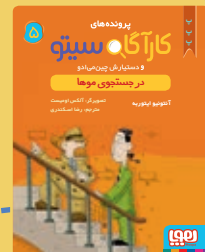
در جستجوی موها