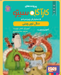
سال نوی چینی