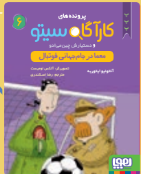
معما در جام جهانی فوتبال