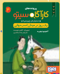
یک روز در میدان اسب‌دوانی