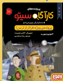
پرونده ویژه: فراتر از ترس