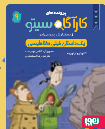
یک داستان خیلی مغناطیسی