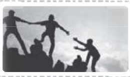
Helping and supporting each other

این چهار تصویر، مربوط به موضوع «قدرشناسی» و شیوه‌هایی است که افراد می‌توانند با مراقبت از یکدیگر برای داشتن زندگی بهتر انجام دهند.