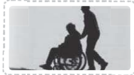
Taking care of elders