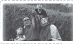
Spending time together as a family

اوقاتی را به عنوان یک خانواده با هم گذراندن